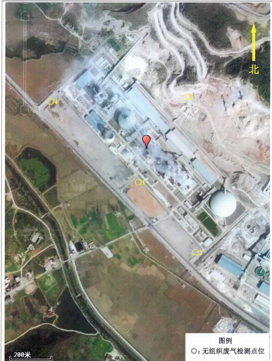
附图 1：现场检测点位平面布置图